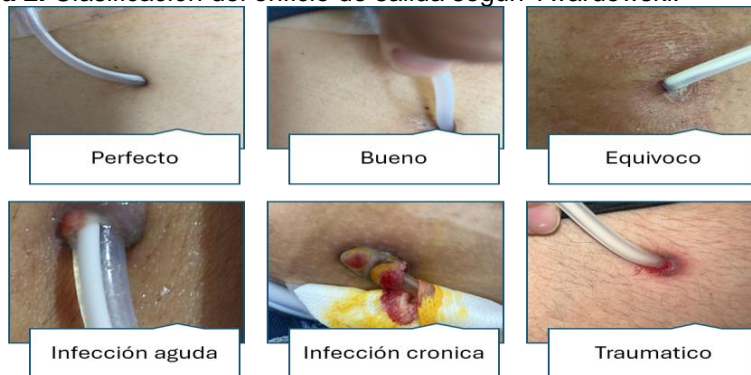
Figura 2. Clasificación del orificio de salida según Twardowski.

Nota: Elaboración propia. Imágenes de pacientes con catéter peritoneal que fueron valorados en una unidad renal local.