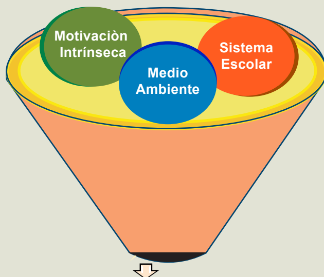
GRÁFICO # 2